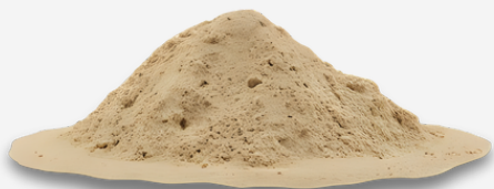
Arena de peña