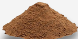
Arena de pozo