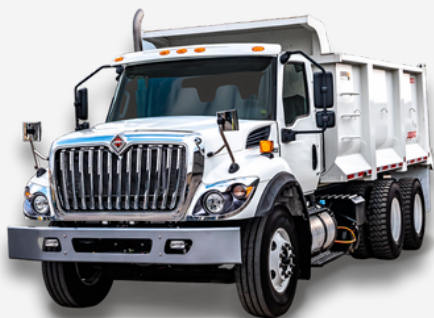
Volqueta doble troque