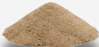
Arena de río