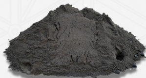
Arena de río