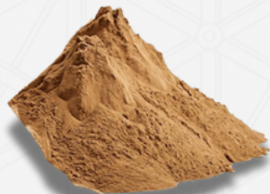
Arena de pozo